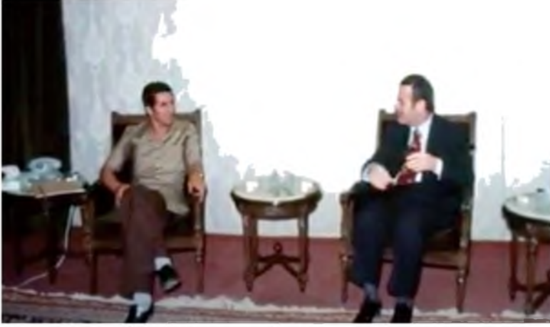
جانب من محادثات بين حافظ الأسد وعبد السلام جلود، سورية.